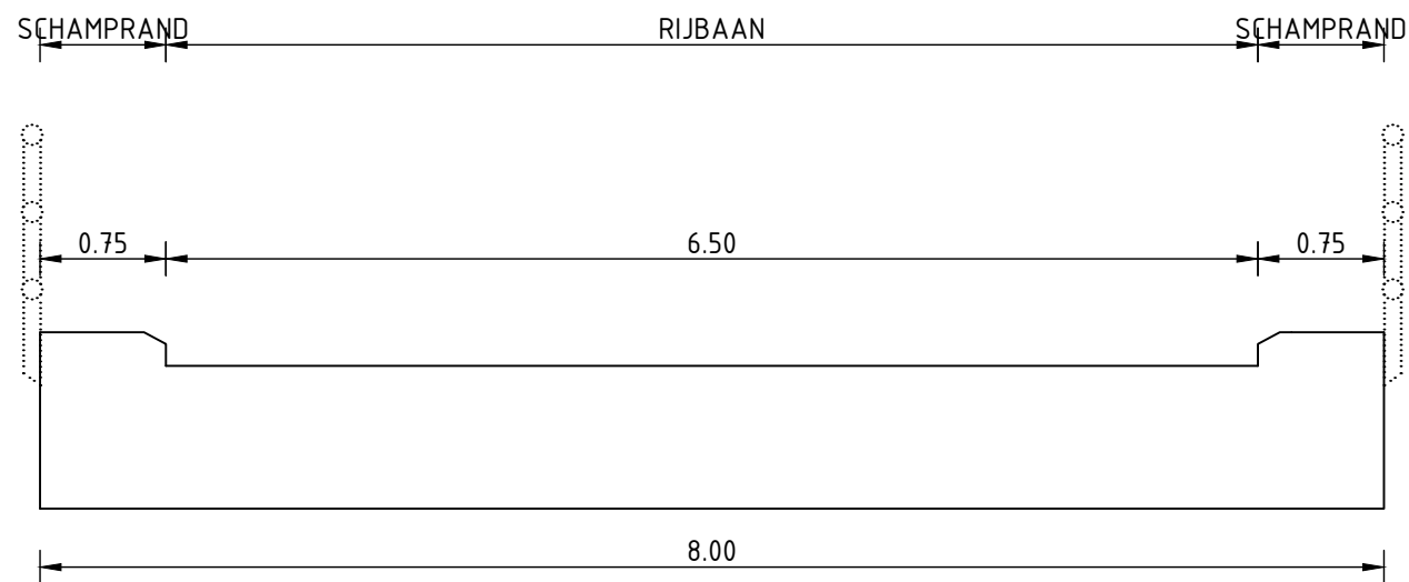
Verkeersbrug (type L) Schaal 1 op 50